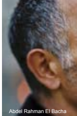
Abdel Rahman El Bacha